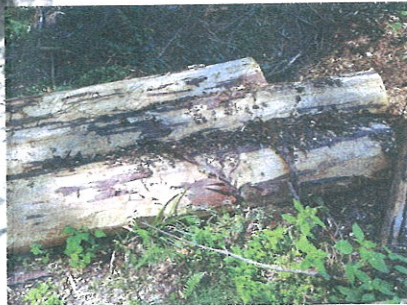
Asanace pomocí odkorňení.

Ruční odkorňování je velice účinné (nelze jej ale použít ve stádiu žlutého brouka s výjimkou odkorňovacích adaptérů na motorovou pilu). Oloupání kůry z pokáceného kmene v malém množství nevyžaduje pro fyzicky zdatného vlastníka zásadní náklady, kromě investice do vlastního času a často je pro drobného vlastníka lešů jedinou dostupnou metodou. Chemická asanace nemá z hlediska vývojového stádia omezení, výkon je vyšší, ale pro drobného majitele lesa existují omezení v zajištění přípravků pro chemickou asanaci. Alternativou je odkorňování pomocí adaptérů na motorovou pilu, ale je třeba vlastnit pilu s odpovídajícími parametry.