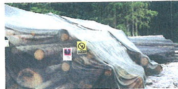
Ochrana skládek pomocí insekticidních sítí.

Asanační metoda odvozem napadeného dříví z lesa byla zavedena v 80. letech, kdy následovalo v průběhu několika dní zpracování, jehož součástí bylo většinou i odkorňování. V nedávné době byla tato metoda „modifikována“ na odvoz za hranice lesa, kde lýkožrout dokončil svůj vývoj a „vrátil se“ do lesa, kde napadl další stromy. Toto je proto v současné době zakázáno. Aktivní kůrovcové dříví musí být asanováno!