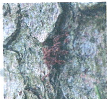
Drtinky na patě stromu.

Včasná asanace napadených stromů s využitím všech dostupných metod zabrání nebo omezí napadení dalších stromů a tím se vynaložené náklady vrátí. Je nutné brát v potaz omezení jednotlivých metod a zohlednit je pro konkrétní situaci.